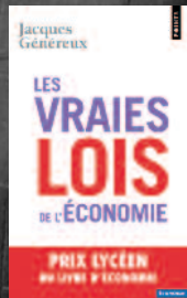
Les Vraies lois de l'économie (368 pages, 9 €)